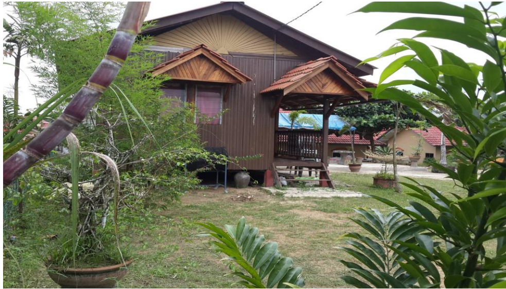
Caption : Chalet