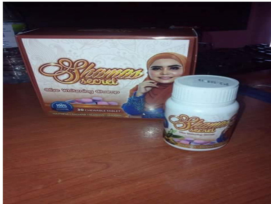
Caption : Olive Whitening Champ