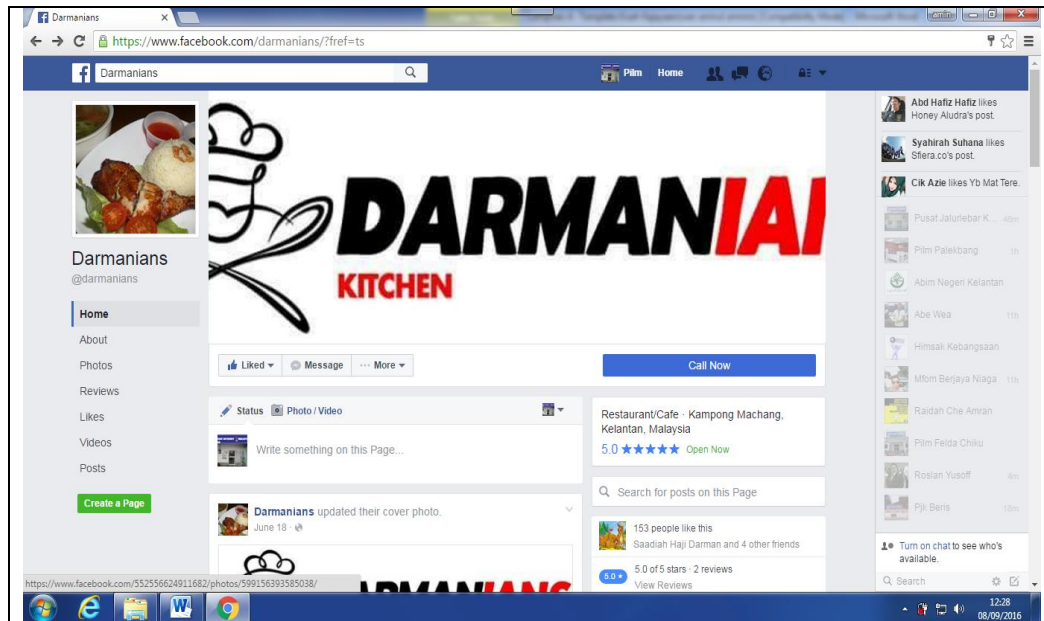
Caption : Darmanians