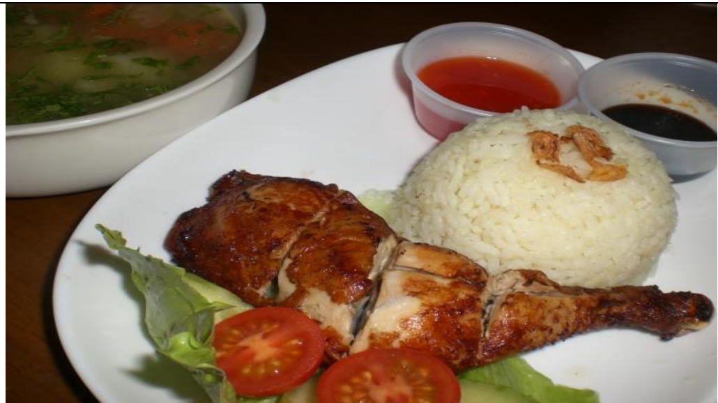
Caption : Nasi Ayam Darmanians