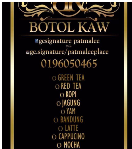
Caption : Botol kaw GcSignature