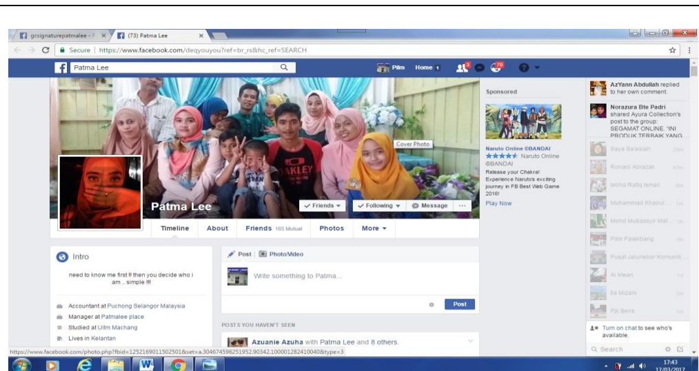
Caption : www.facebook.com/deqyouyou