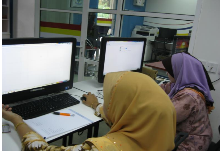
PESERTA SEDANG MENGIKUTI KURSUS LATIHAN KEUSAHAWANAN.