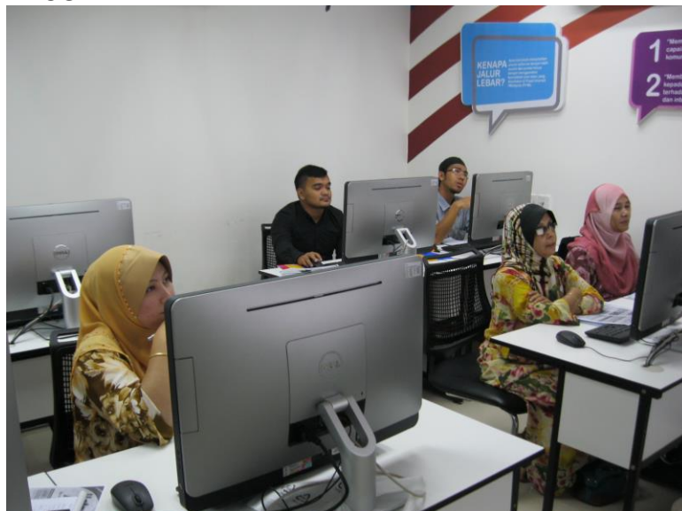
PESERTA SEDANG MENGIKUTI KURSUS LATIHAN KEUSAHAWANAN.