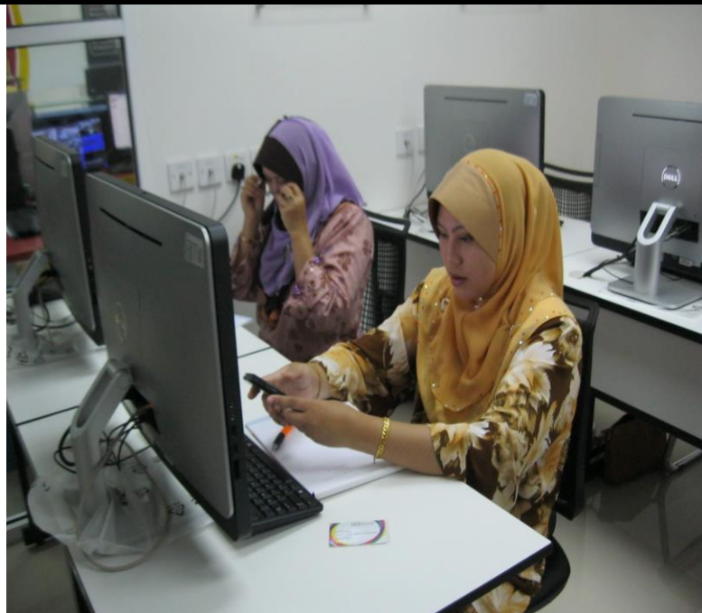
PESERTA SEDANG MENGIKUTI KURSUS LATIHAN KEUSAHAWANAN.