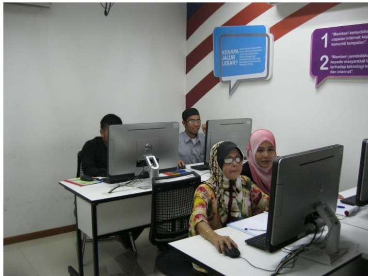
PESERTA SEDANG MENGIKUTI KURSUS LATIHAN KEUSAHAWANAN.